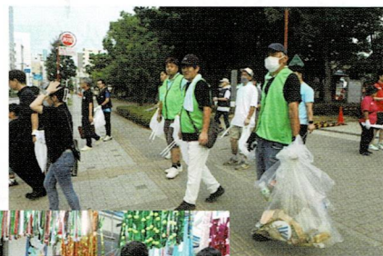
あつぎ鮎まつり 会場での様子