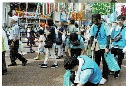
湘南ひらつか七夕まつり 会場での様子